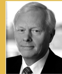
Prof. Dr. Reinhard Burger